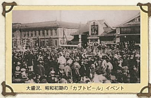
大盛況、昭和初期の「カプトビール」イベント