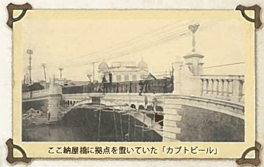
ここ納屋橋に拠点を置いていた「カプトビール」